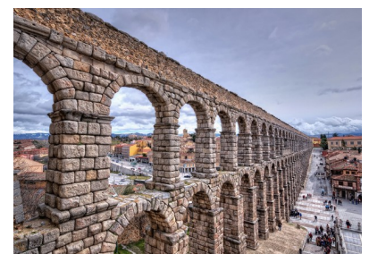
❻ Aqueduc, Ségovie, Espagne