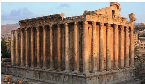
❶ Temple de Bacchus, Baalbek, Liban