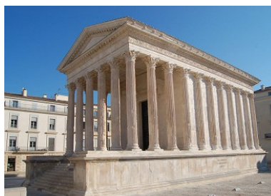
❺ Maison Carré, Nîmes, France