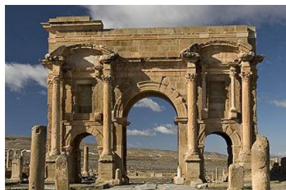
❷ Arc dit de Trajan, Timgad, Algérie