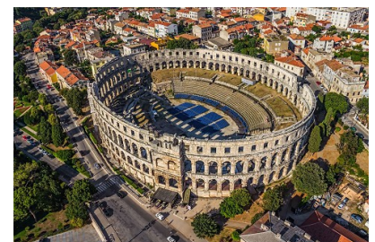
❸ Amphithéâtre, Pula, Croatie