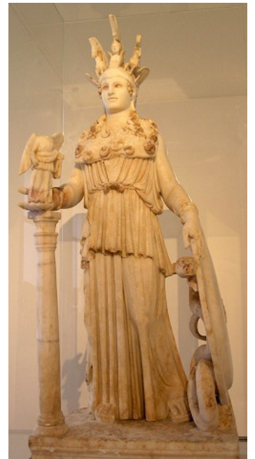
La monumentale statue chryselephantine d'Athéna telle qu'elle apparaissait à l'intérieur du Parthénon. D'après des copies datant de l'époque romaine. Hauteur de l'œuvre 12 mètres.