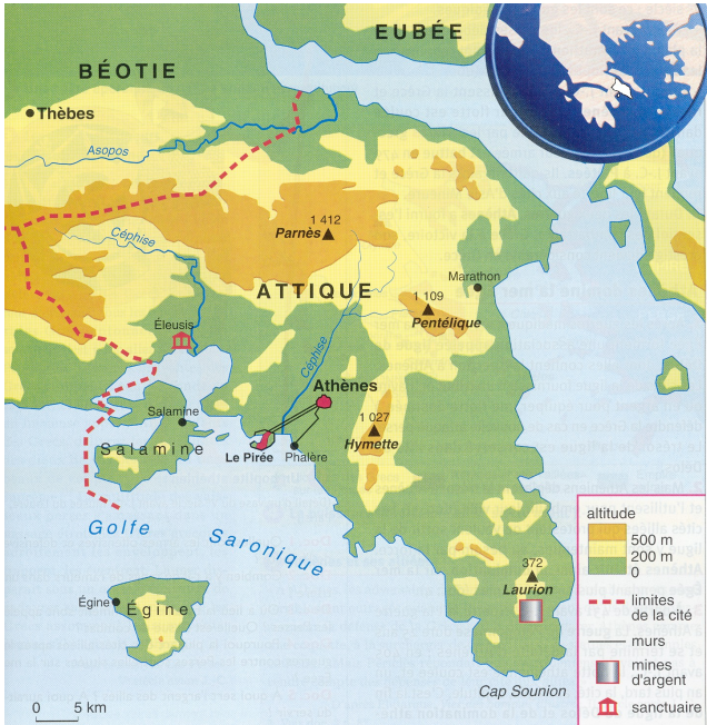
Athènes, une immense cité qui couvre toute l'Attique