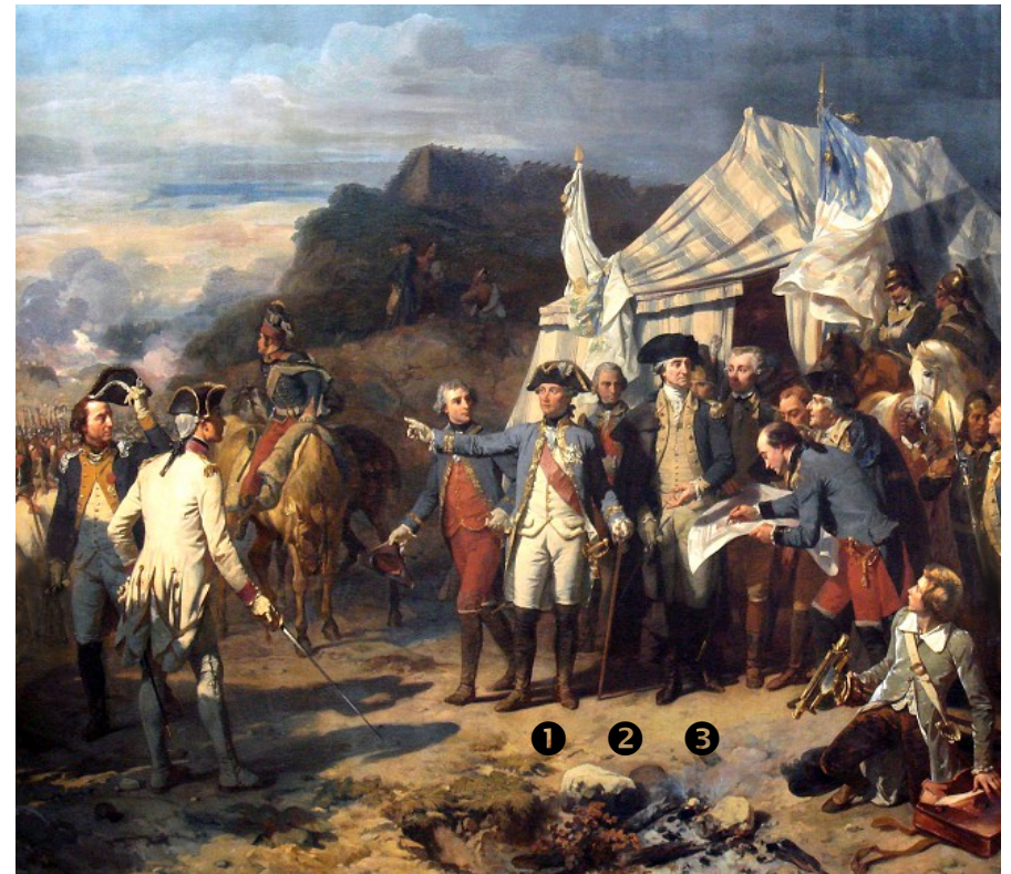
La bataille de Yorktown par Auguste Couder