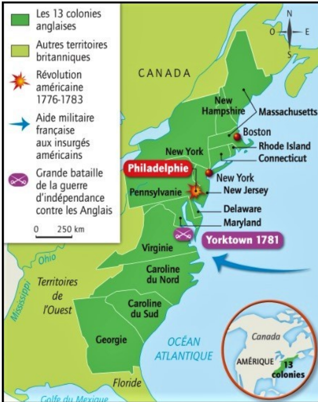
La guerre d'indépendance américaine