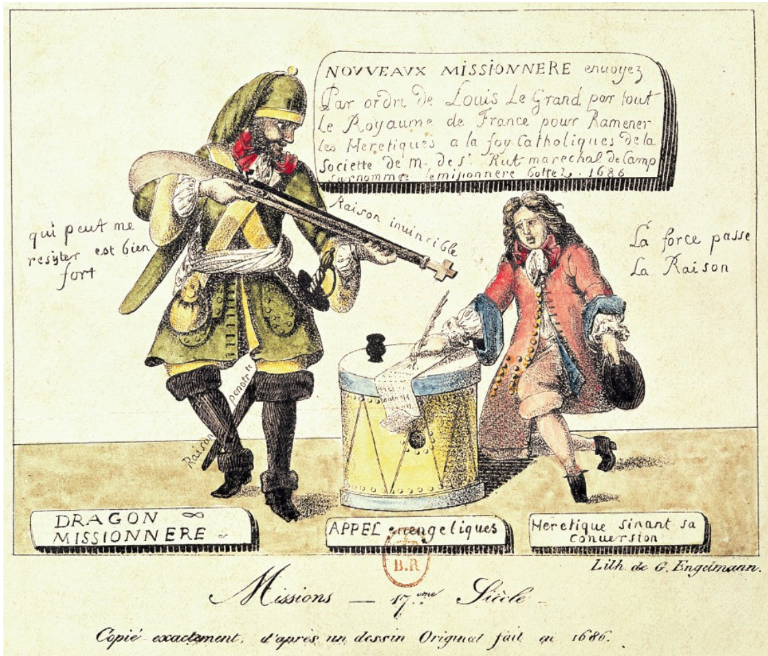
Gravure protestante représentant les dragonnades en France, Musée international de la Réforme protestante, Genève, Suisse