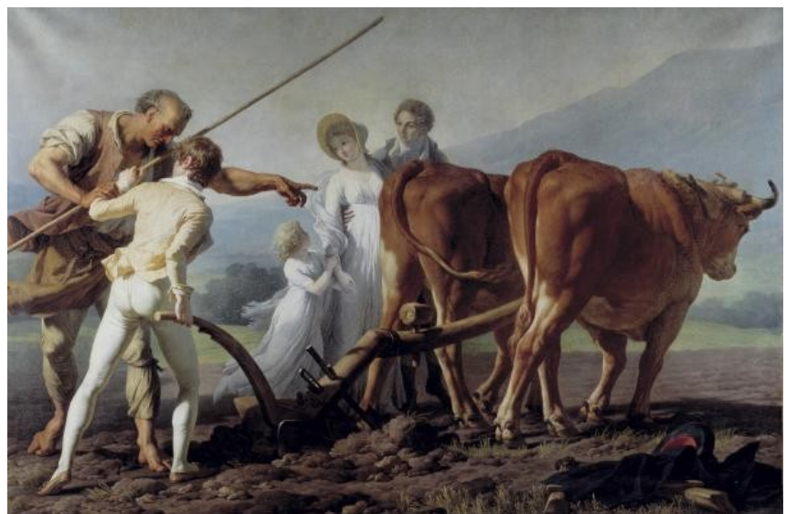
Agriculture, par François-André Vincent, 1797-1798, Musée des Beaux-Arts de Bordeaux. Une illustration symbolique de l'esprit physiocratique. Un paysan éduqué au labourage un jeune bourgeois en tenue de ville devant sa famille. La charrue représentée bénéficie des dernières innovations technologiques de l'époque avec un soc, un versoir et deux coutres en fer.