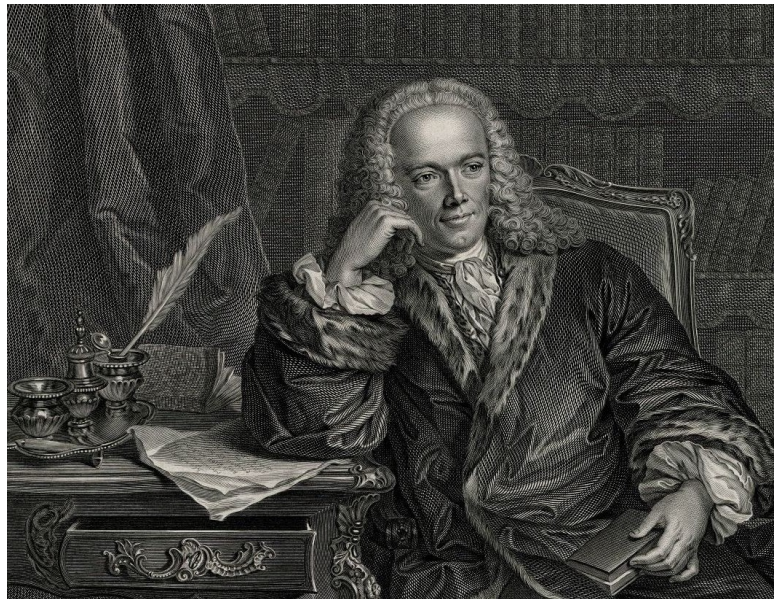
François Quesnay par Johann Georg Wille, 1747, d'après Jean Chevalier

D'après François Quesnay, article «Grains», l'Encyclopédie, tome 7, 1757