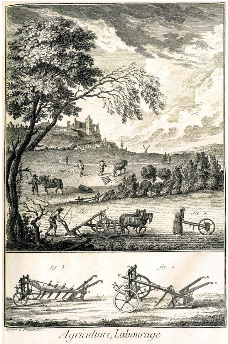
Les techniques modernes d'agriculture et de labourage. Planche de l'Encyclopédie de Diderot et d'Alembert, 1762.