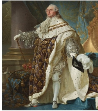
Roi (Louis XVI)