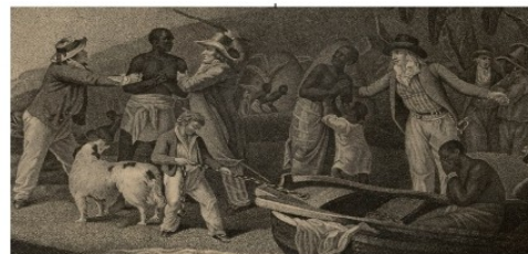
Esclave (dans les colonies)