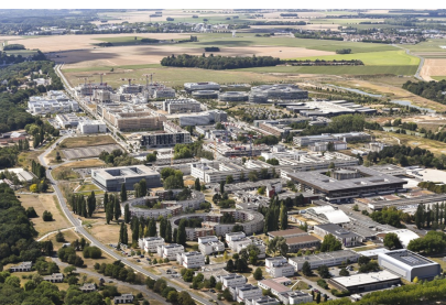
Plateau de Saclay