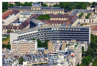
Palais de l'UNESCO