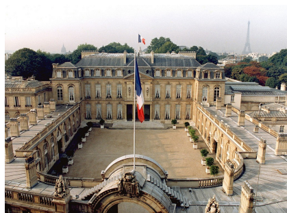
Palais de l'Élysée