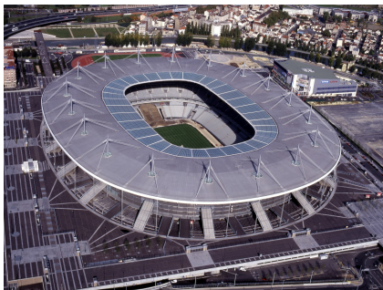
Stade de France