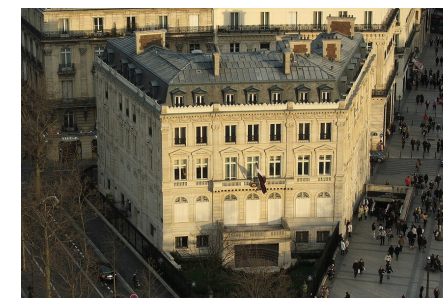
Ambassade du Qatar